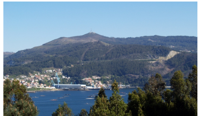
O Faro de Domaio, o cumo máis alto do Morrazo, desde Vigo