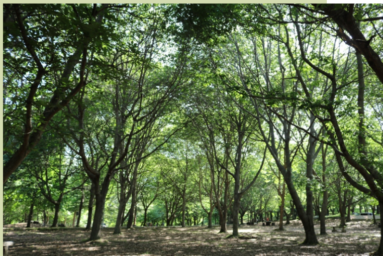
Interior do bosque de Chan da Arquiña