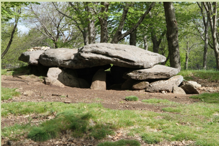
Dolmen de Chan da Arquiña