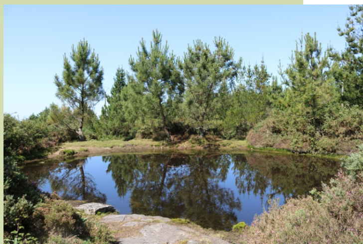
Lagoa no Coto do Home