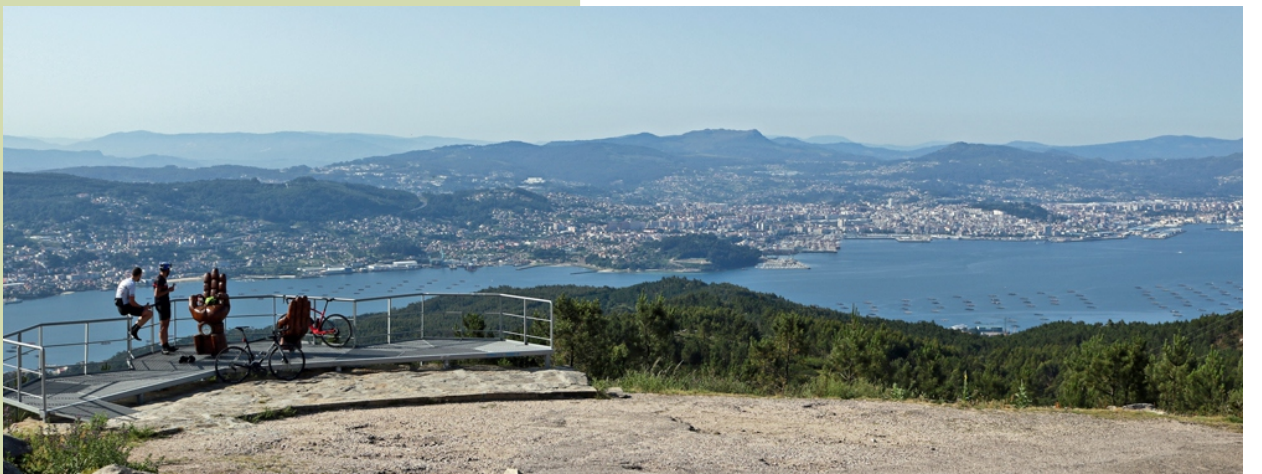
Miradoiro do Faro de Domaio e ría de Vigo

Na zona hai numerosas mámoas, varias escavadas (Chan de Castiñeiras, Chan da Arquíña, Chan da Armada...).