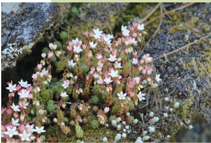
Uvas de lagarto ( Sedum )