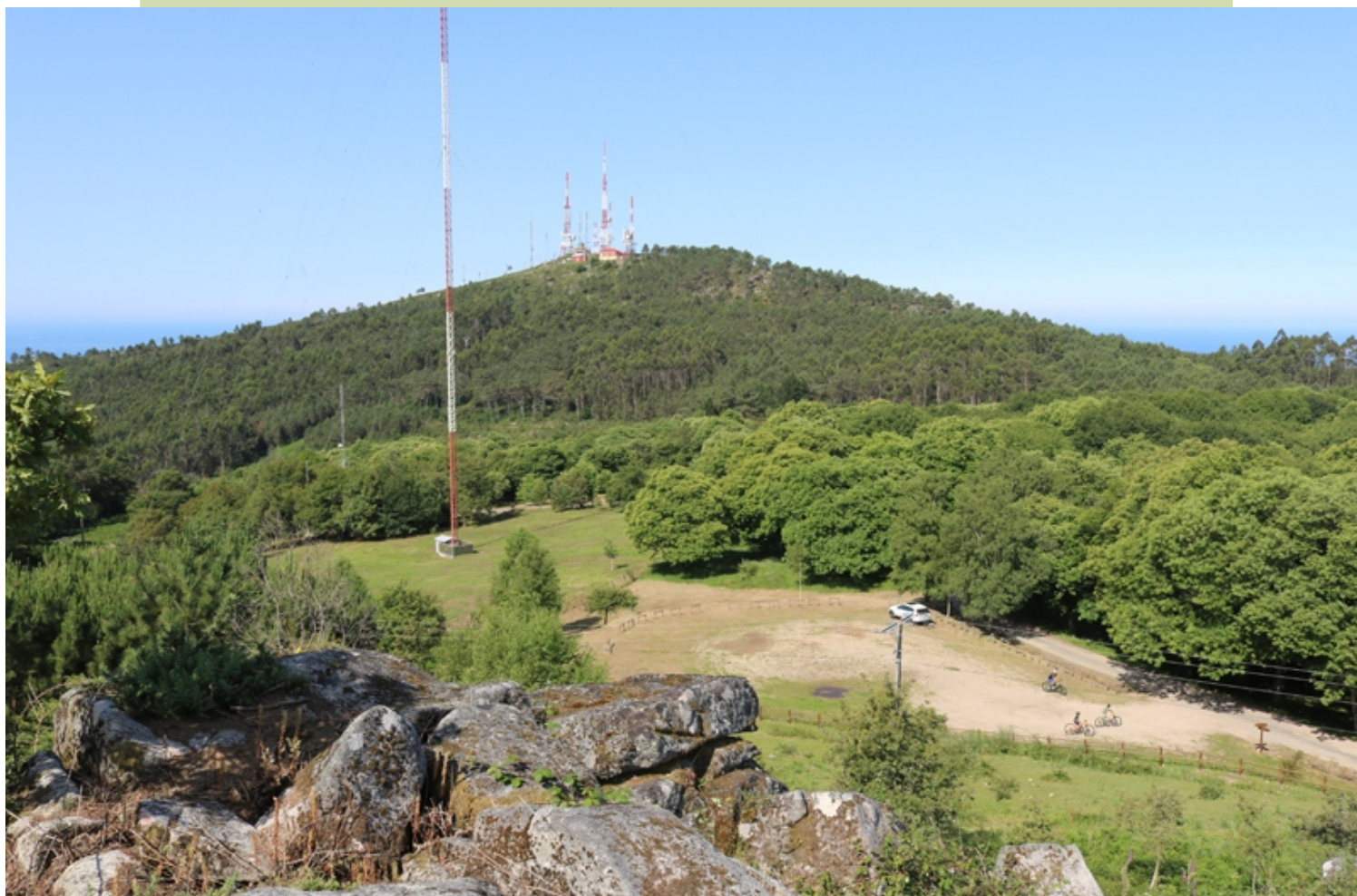
Bosque de Chan da Arquiña e cume do Faro de Domaio desde o miradoiro do Candón Pequeno.