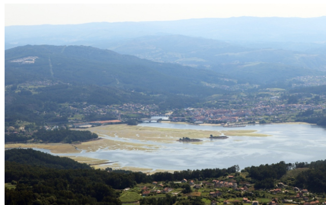
Desembocadura e esteiro do río Verdugo desde o Coto do Home.