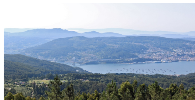
Vista cara a Rande